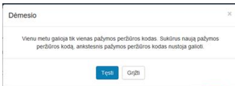
2 paveikslas. Pasirinkti tęsti veiksmą

Sistema sugeneruoja naują pažymos peržiūros e. sveikatos portale kodą, kuris rodomas atnaujintame medicininės pažymos peržiūros lange.